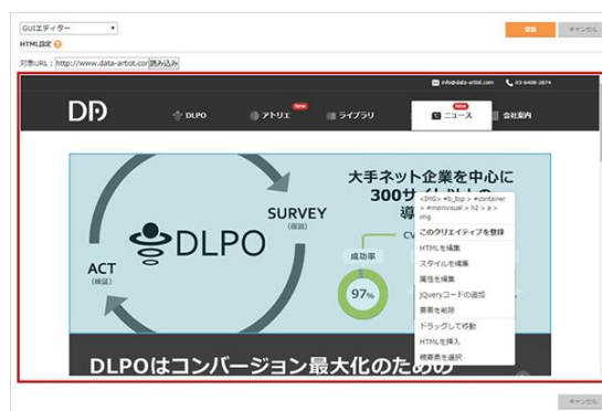
GUIエディター画面イメージ

GUIによるドラッグ&ドロップ操作でクリエイティブパターンを容易に作成できる機能。管理画面内で、デザイン・文字要素・CSSなどの設定が完了します。