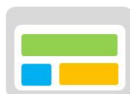
Aパターンのヒートマップ

Google AnalyticsやClicktaleの各指標でテスト結果を評価できるウェブ解析ツール連携機能。テストデータをウェブ解析ツールにシームレスに組み込むことができます。