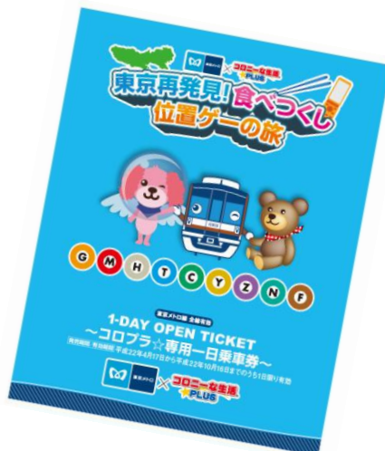
専用台紙(イメージ)