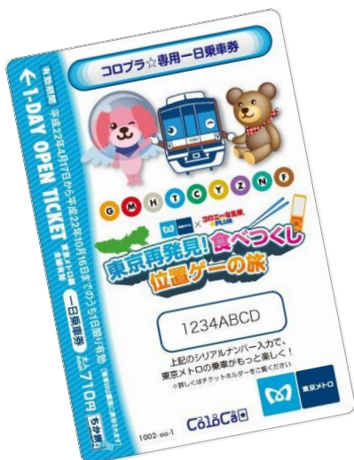
「コロカ」デザインの日乗車券(イメージ)