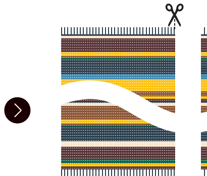
平織りの生地を縦糸に沿って裁断します。