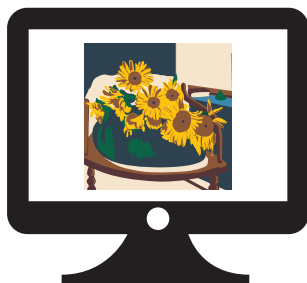
コンピューターで色構成して、平織りの反物を制作します。

ドイツを本場としたヨーロッパ伝統織物です。カーペットのために開発された技術で、一度織り上げた生地を縦に切り分け、撚りをかけてモール状にしたものを横糸として再び織り上げるので「再織」とも呼ばれています。こうして出来たシェニール織りは、触り心地、吸水性、丈夫さに定評があります。