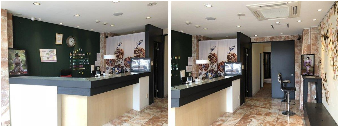
ホステル「GRAND-REM KYOTO」のフロント

京都フラワーツーリズムが毎月開催している「舞妓さんの撮影会」で撮られたショットを、海外のお客さま向けホステルで開業当日の8月20日より展示。海外から多くのお客様が予想される中、日本を代表する美でおもてなしします。