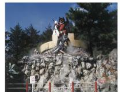
カマド地獄 Kamado Jigoku