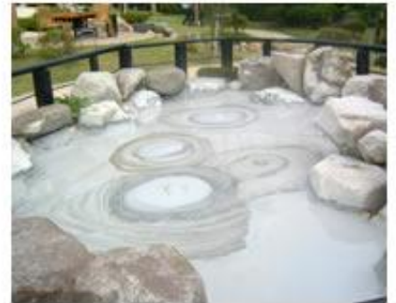
鬼石坊主地獄 Oniishi Bouzu Jigoku