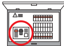
分電盤タイプ(内蔵型)