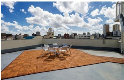
コミュニティスペース(屋上)

屋上はコミュニティスペースに。 夏はBBQや隅田川の花火鑑賞。 冬は雪見などをお楽しみ下さい。