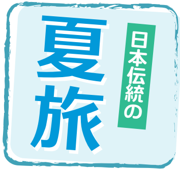
C4 ランタン+C4 サマリウムアール