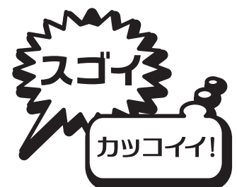
C4 テルル / C4 サマリウム