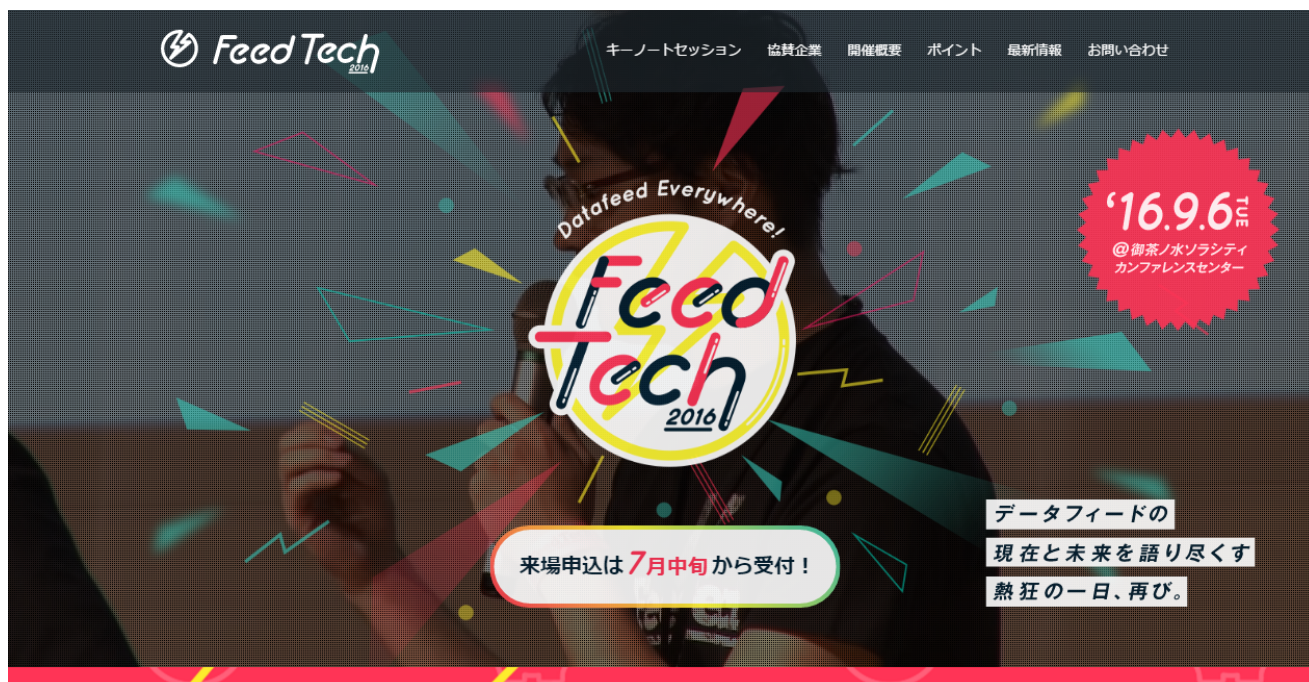
図1 FeedTech 2016 特設サイトイメージ

来場事前申込みの受付は、特設サイト（ https://feedtech.net ）にて2016年7月中旬より開始予定で、1,000名以上のお申込みを見込んでおります。