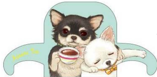
ルル (♂) ララ (♀)

仲よしチワワのカップル“ルル”と“ララ”。 お調子者のルルは、みんなのムードメーカー。 大好きなララがそばにいる時は、白い毛並みに優しく 触れながら、ララへの恋の想いに一直線！