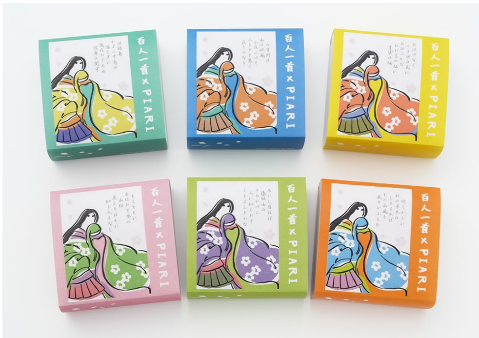
百人一首シリーズ限定パッケージ