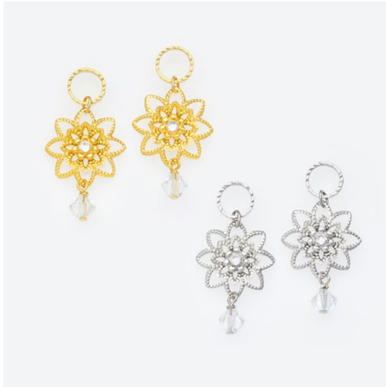
限定のカスタマイズチェーン「美影」