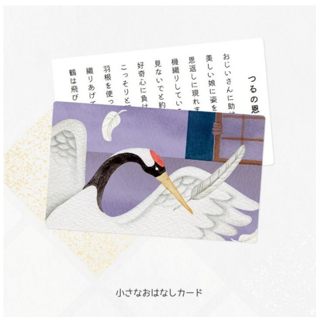
小さなおはなしカード