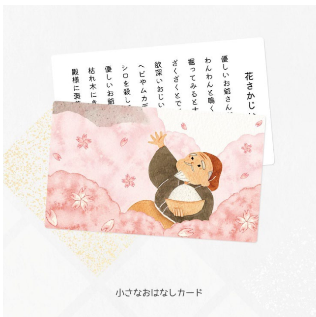
小さなおはなしカード