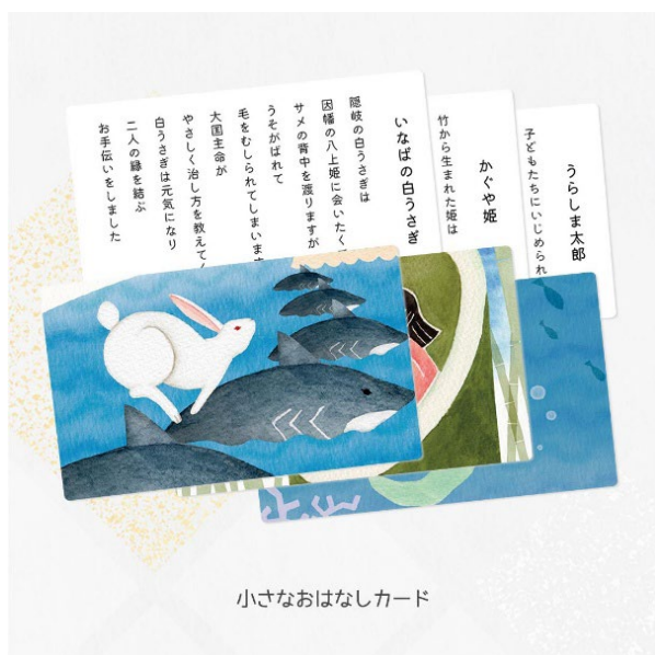
小さなおはなしカード