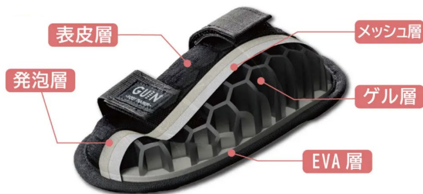
GUIN-FOOT TRAINER-の特殊 5 層構造