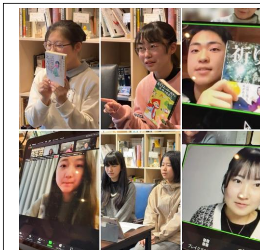
中高生の推し本バトル（2023 年 2 月）

また、事務局となるあひる図書館では、本好きな中高生や、あるいは将来的には不登校のお子さんの居場所の一つとして、場が成長していくことを願っており、図書館の認知向上の期待も込めて、昨年も中高生の推し本バトル（ビブリアバトル）を開催している。本プロジェクトを通して、さらなる中高生の認知向上、利用拡大を期待したい。