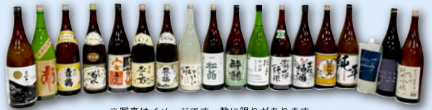
※写真はイメージです。数に限りがあります。