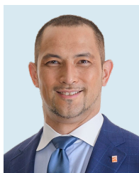
スポーツ庁長官 室伏 広治 氏