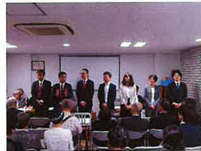
選定された日建設計・東急不動産の皆さん