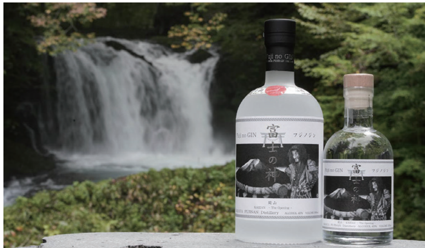
富士の神 開山 500ml（左）200ml（右）

直営店のなだや本店、道の駅富士吉田、富士山 5 号目観光売店、富士五湖周辺の土産物店等で販売を開始。