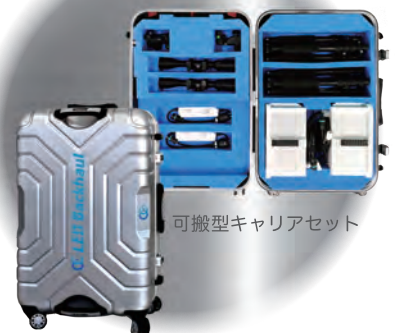
可搬型キャリアセット

Powered by Fraunhofer Heinrich Hertz Institute