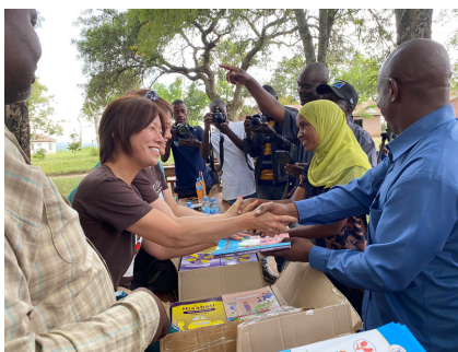
2021年3月 教科書進呈時の際、現地メディアに取材された様子