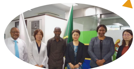
イベント当日は在日タンザニア大使館より応援参加頂けることが決定致しました！