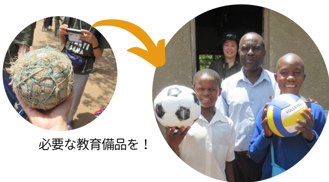
必要な教育備品を！

私達の活動は単なる物質支援にとどまらず、子供たちや保護者・地域の方々の教育への意識変革をもたらし、地域全体で子供たちの教育を高めていく動きにつながってきています。教科書支援の次は、教育を受けた子供達のための雇用開発に移行する予定です。