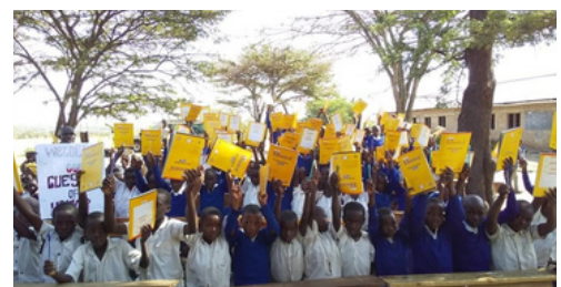
ノートとペンと教科書があることは、決して当たり前のことではありません。