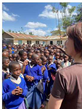
「女の子も勉強を頑張って、夢を諦めないで！」