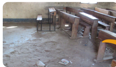
安心、安全に学べる環境を！