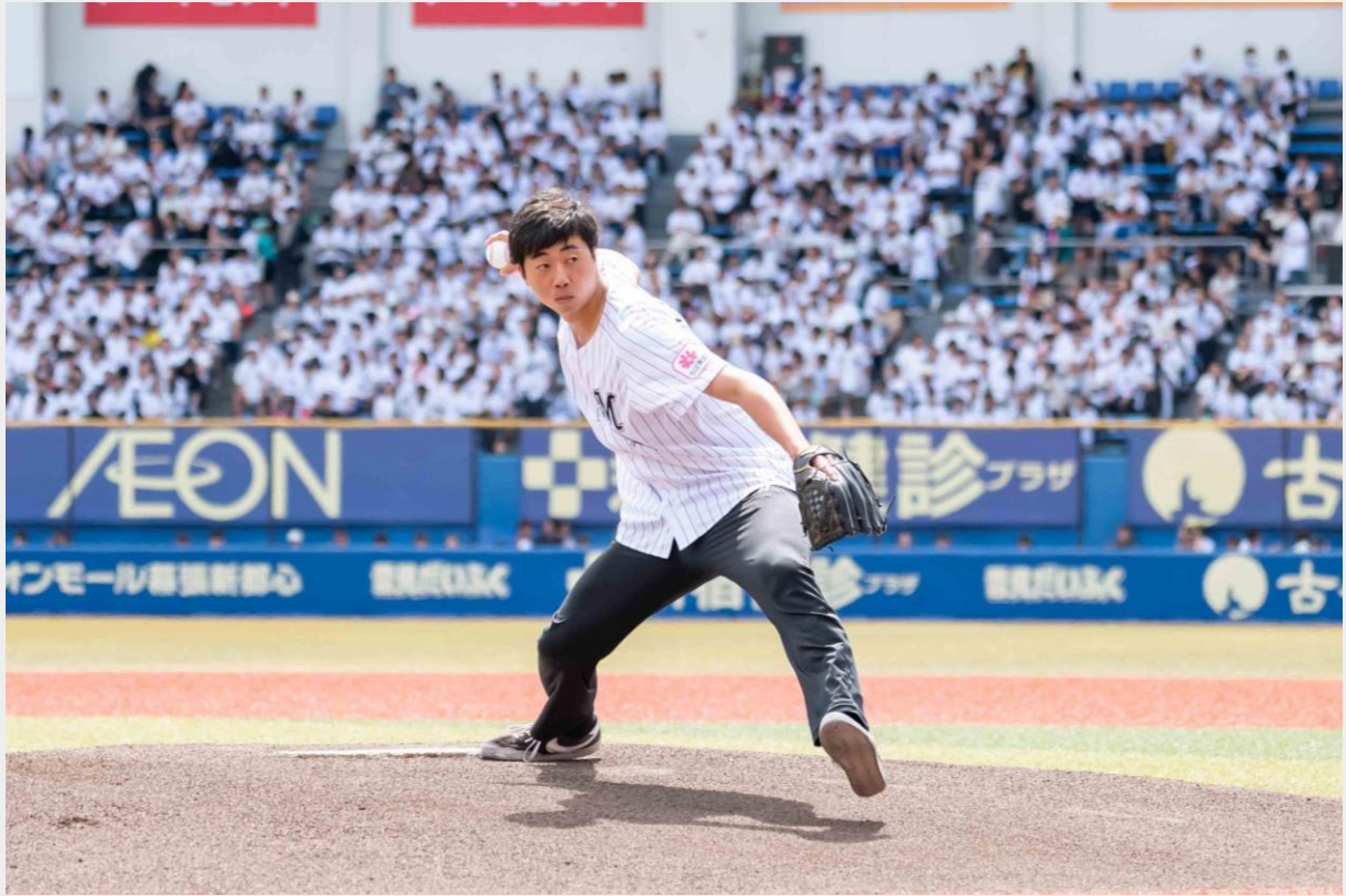
とても綺麗なノーバウンド投球！！ 会場には約3万人の観客の驚きの声と、盛大な拍手が響きました。