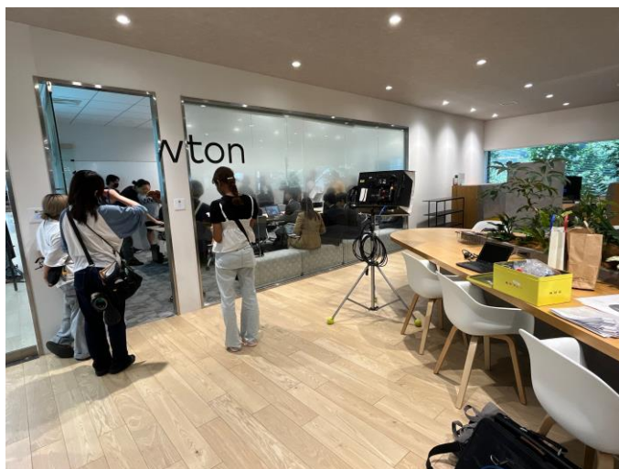
(「おいハンサム!!2」ドラマ撮影の様子) ②