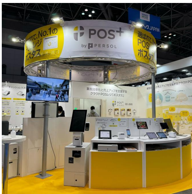
（リテールテックJapan2024出展時の「POS+（ポスタス）」ブースの様子）

今後も当社は、業界特化のクラウド型モバイルPOSレジやセルフレジ/券売機などの非接触・省人化サービスの提供を通じて、サービス事業者様（飲食店・小売店・理美容店・クリニック）の生産性向上を支援してまいります。