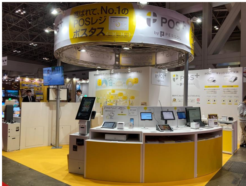
(第52回国際ホテル・レストラン・ショー (HCG2024) 出展時の「POS+（ポスタス）」ブースの様子)

今後も当社は、業界特化のクラウド型モバイルPOSレジやセルフレジ/券売機などの非接触・省人化サービスの提供を通じて、サービス事業者様（飲食店・小売店・理美容店・クリニック）の生産性向上を支援してまいります。