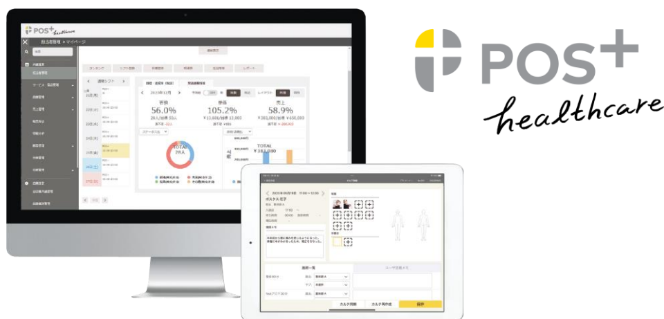
（「POS+ healthcare」 ※イメージ）

サービス開始10周年を迎えたタイミングで、店舗運営に携わる皆さまへの支援をさらに広げていくべく、マーケット規模も大きく、以前からサービス展開のご要望が多い、ヘルスケア領域のサービスを開発しこの度リリースすることとなりました。「POS+ healthcare」について： https://www.postas.co.jp/service/postas-healthcare/