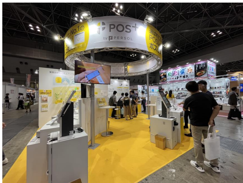
(昨年FOOD STYLE Japan2023出展時の「POS+（ポスタス）」ブースの様子)

今後も当社は、業界特化のクラウド型モバイルPOSレジやセルフレジ/券売機などの非接触・省人化サービスの提供を通じて、サービス事業者様（飲食店・小売店・理美容店・クリニック）の生産性向上を支援してまいります。