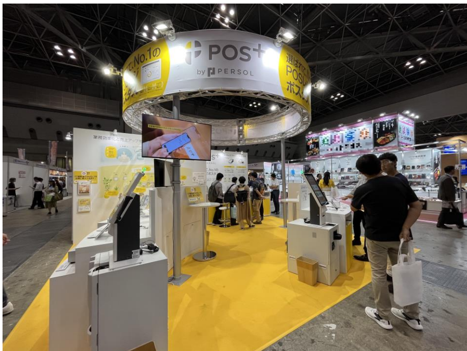
(FOOD STYLE Japan2023の「POS+（ポスタス）」ブースの様子)

今後も当社は、業界特化のクラウド型モバイルPOSレジやセルフレジ/券売機などの非接触・省人化サービスの提供を通じて、サービス事業者様（飲食店・小売店・理美容店）の生産性向上を支援してまいります。