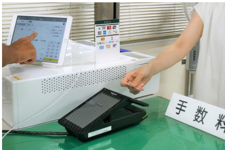
(警視庁様での導入の様子)