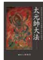
太元帥大法 パンフレット