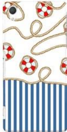
ストライプ浮き輪