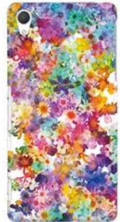
ドリーミングガーデン