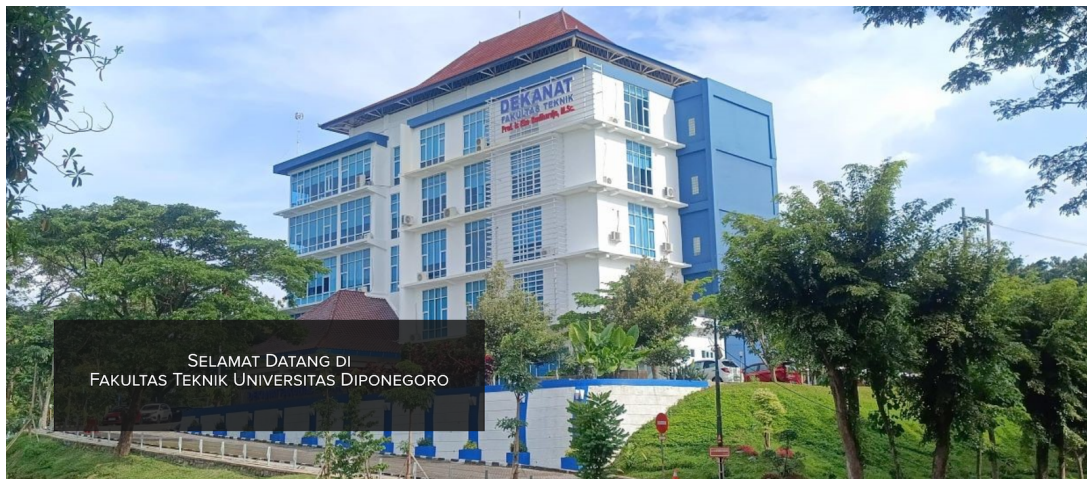
ディポネゴロ大学