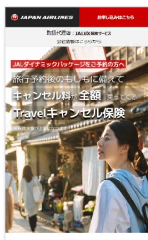
保険の案内ページ