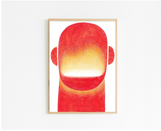
◀[いおり] 『12/12 1200℃』