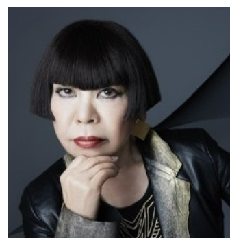
▲コシノジュンコ氏 ◀ JAL アートサロン TOP 画面