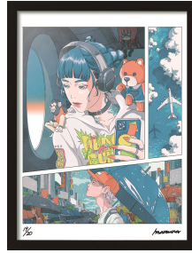
◀[イマムラ] デジタル版画『FRONTIER』