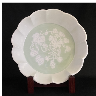
▲[井上萬二] 陶芸『白磁緑釉染葡萄彫文花形花器』