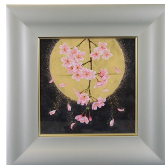
▲[高井美香] 日本画『春の舞』