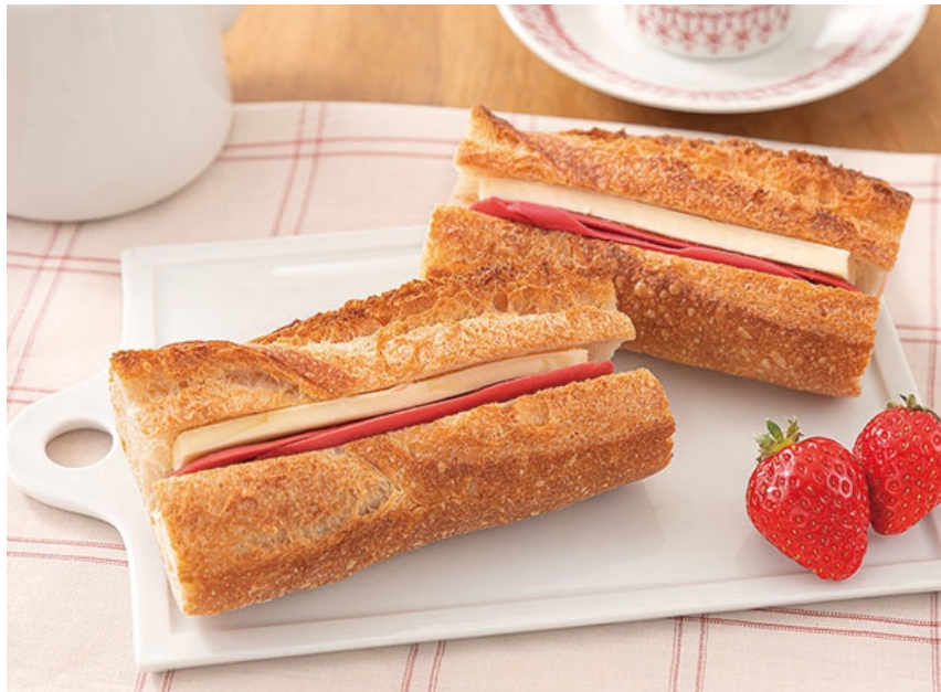
「苺ショコラバターサンド」

株式会社 JALUX（ジャルックス：代表取締役社長：高濱悟）が手掛ける日本初出店のベーカリー「ティエリー マルクス ラ ブーランジェリー」（東京都渋谷区）は、東武百貨店 池袋本店で開催される「IKEBUKURO パン祭」に出店いたします。出店期間は2023年3月23日から3月28日までの6日間で、会場では同店人気商品「あんバターサンド」をアレンジした「苺ショコラバターサンド」を数量限定で販売いたします。