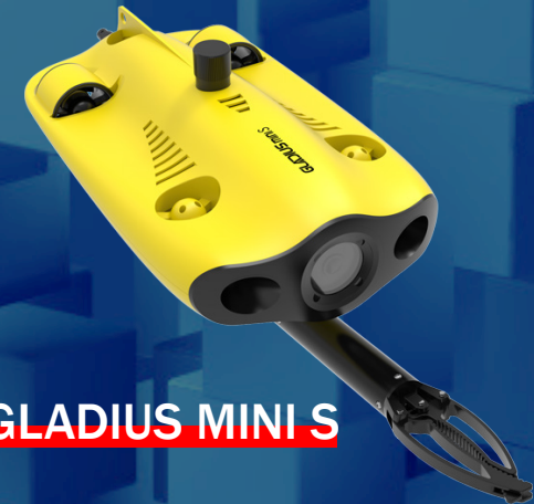
GLADIUS MINI S