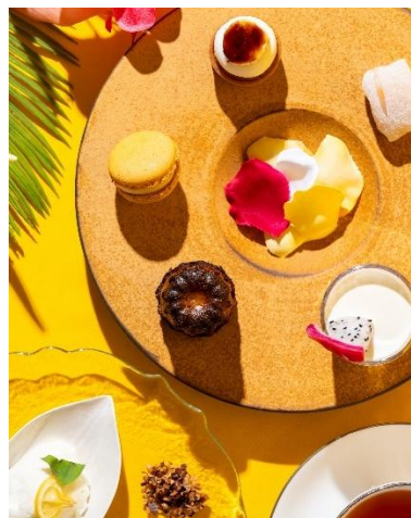
トピカルフルーツを主役にした「夏のトピカル・アフタヌーンティー」