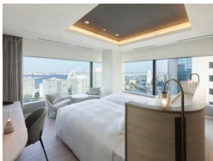
客室エグゼクティブコーナーツイン(46.1㎡)