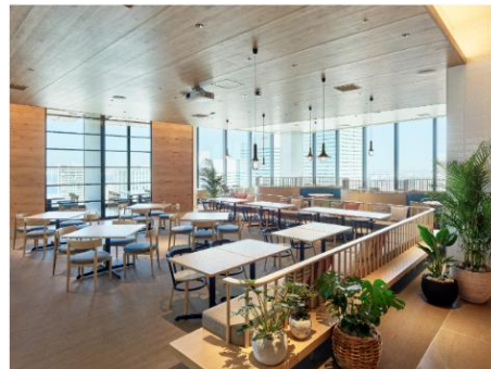
大きな窓からハーバービューが望めるレストラン