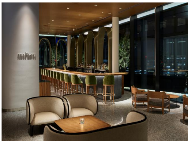
20階 BAR BELLO GATTI(バー ベッロ ガッティ)