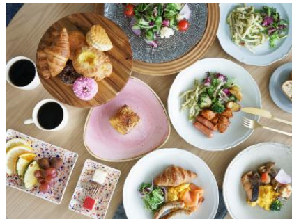
朝食(フレンチトーストは ライvkitchenで出来立てを提供)