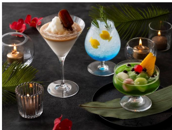
※写真左から フローズンアフォガート、Summer Ripple、翠庭