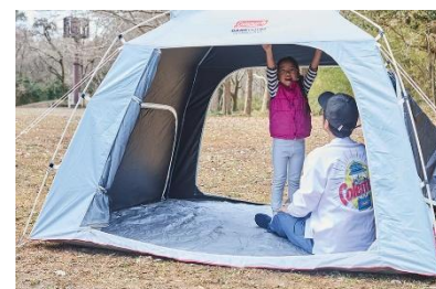
ピクニック イメージ