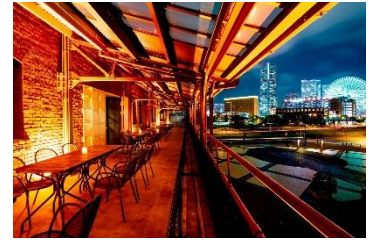
横浜赤レンガ倉庫 2号館 3F バルコニー席

横浜赤レンガ倉庫 2号館 3Fには、みなとみらいや横浜港を一望できる眺めの良いバルコニー席をご用意しており、海からの風を感じながら至福の時間を過ごせます。バルコニー席でお楽しみいただける2号館 3Fレストランのメニューをご紹介します。