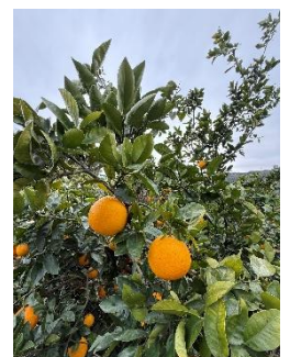
矢郷農園の河内晩柑