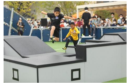
パルクール鬼ごっこ イメージ