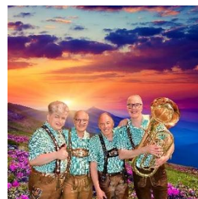
ドイツ楽団 イメージ