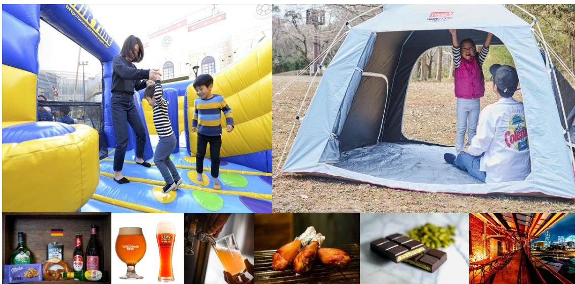
『Yokohama Frühlings Fest 2025』のコンテンツ・メニュー・施設一例

横浜赤レンガ倉庫では、2025年4月25日(金)から5月6日(火・祝)の計12日間、横浜赤レンガ倉庫イベント広場・赤レンガパークにて『Yokohama Frühlings Fest 2025』を開催します。メニューやコンテンツの詳細が決定したためお知らせします。