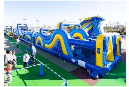
巨大アスレチック“エアertimeラン” イメージ