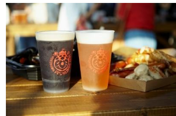
リユースカップ イメージ

地場の海鮮や野菜などの食材を使用した BBQ メニューをご提供するほか、地元醸造メーカー等の地元企業が出店します。