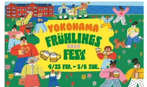
『Yokohama Frühlings Fest 2025』キービジュアル