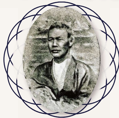
ホイットフィールド船長とジョン万次郎