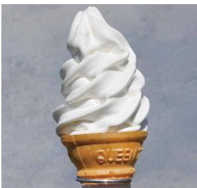
● 初登場 [群馬] みるく工房タンポポ／ 牧場ソフトクリーム(1本)501円