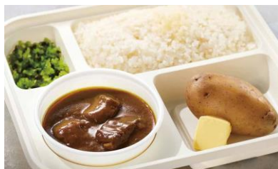
●[東京]オーベルジーヌ東京三田/ ロケ弁ビーフカレー(1折)1,674円 ロケ弁で有名な本格欧風カレー。