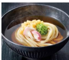
●[香川]日の出製麺所/生うどんパック (300g、1パック)395円 実演 ※写真は調理例です。