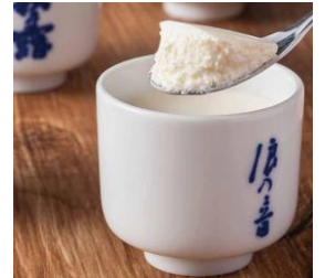
● 初登場 [滋賀] 工房しゅしゅ／湖のくに 生チーズケーキ(猪口入) (6種、1個)各605円