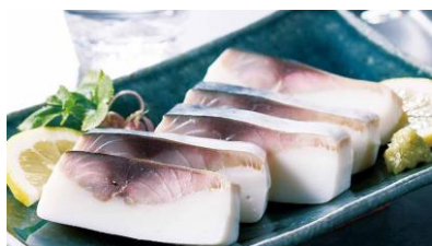
●[島根]寿隆蒲鉾/しめ鯖かまぼこ (約200g、1本)1,593円 ※写真は盛り付け例です。