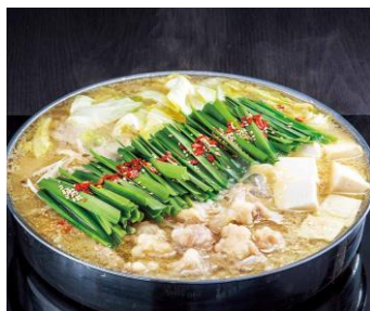
●[福岡]博多もつ鍋星まつり/ もつ鍋(みそ味・醤油味)(2~3人前セッ ト、冷凍)各3,996円 ※写真は調理例です。