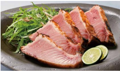
●[石川] 逸味潮屋／天然能登寒ぶりの たたき(石川県産100gあたり、1個、冷凍) 2,160円 [各日限定20個] 外は炙りで香ばしく、中はとろけるような脂と 旨味。※写真は盛り付け例です。