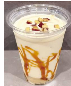
● 初登場 [東京] 芋栗／飲む焼き芋 (1杯)880円 実演