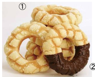
● 初登場 [福岡] 糸島メロンパン専門店 CACHETTE／ ①メロンリング(1個)331円 ②チョコメロンリング(1個)399円 実演