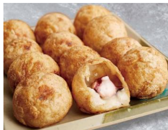
●[大阪]たこ焼き発祥の店 大阪玉手 会津屋/元祖たこ焼き(小箱)(12個 入、1箱)701円 実演