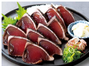
●[高知]高知の魚家さん/ 薫焼きかつおたたき (国内産、100gあたり、冷凍) 1,296円 ※写真は盛り付け例です。