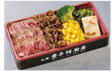
●[北海道] 札幌豊平館厨房／ 十勝和牛昆布熟成ロースステーキ 弁当(1折)2,916円[各日限定50折] 実演