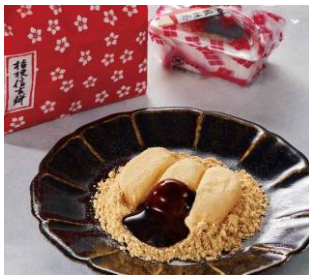
●[山梨] 桔梗屋／桔梗信玄餅 (6個入、1袋)1,296円