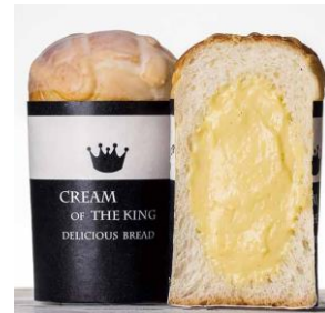
● 初登場 [長野] 麦香房 epi／ 王様のクリームパン(1個)459円 自慢のカスタードが詰まった口どけなめらかなスイーツ。