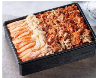
●[福井] 一乃松／せいこかに寿し (一折)3,891円 実演