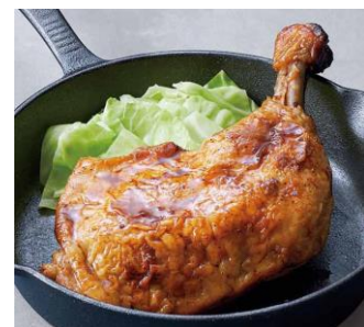
●[香川]骨付鳥 蘭丸/骨付鳥 (おや、ひな、1本)各1,080円 [おやのみ各日限定80本] 実演 ※写真は盛り付け例です。