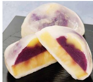
●[熊本] 熊本六季／塩いきなりだご (5個入、1包)1,080円 実演