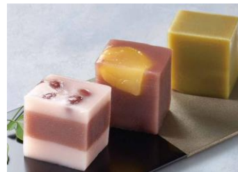
●[三重] 虎屋ういろ／生ういろ (各種、1本)451円から