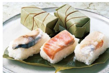
●[奈良]柿の葉すし本舗たなか/ 柿の葉すし(鯖・鮭・鯛、7個入、1箱) 1,329円