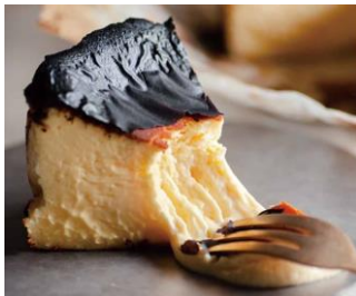
● 初登場 [広島] むすびスイーツ／ バスケットチーズケーキ(直径約12cm、 1ホール)2,981円