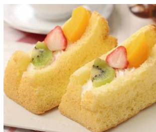
●[京都] まざあぐらす／ 京のふんわりクリームシフォン (フルーツ)(1個)486円