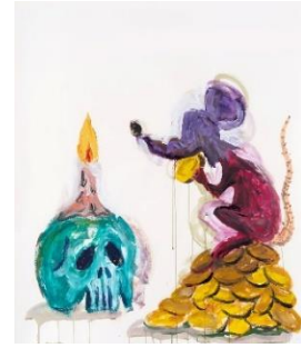
Manuel Ocampo "Untitled" (VETA by Fer Francés)

アジア出身の有名アーティストや、注目の若手アーティストの作品を展示するセクターで、今回は 9 つのギャラリーが参加します。ソウルの PYO Gallery は、水滴の抽象画で知られる韓国人アーティスト Kim Tschang-yeul の作品を展示します。また、マドリードの VETA by Fer Francés は、フィリピン人アーティスト Manuel Ocampo のダイナミックな絵画作品を通じて、植民地時代の図像、ユダヤ教やキリスト教の伝統や、民俗芸術、スペインのカトリシズム、マニラのアンダーグラウンド・カルチャー、漫画、グラフィティなどを組み合わせ、挑戦的な手法で芸術の歴史を再考します。