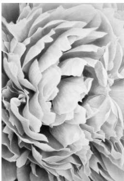
Robert Longo "Untitled (The Ecstasy of Saint Teresa, 1647-1652; After Bernini and White Peonies (detail))" (Pace Gallery)