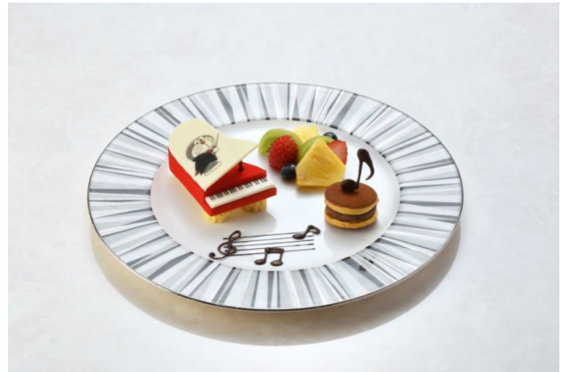
映画ドラえもんデザートプレート 2,277円 1F ロビーラウンジ「フォンテーヌ」