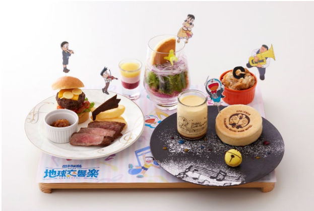
〔映画ドラえもんタイアップ宿泊プラン限定〕 ルームサービスディナー