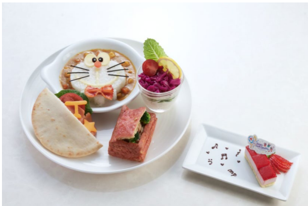
映画ドラえもんプレート 4,427円 1F シェフズダイニング「シンフォニー」