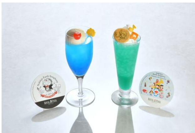
左：ドラえもんのクリームソーダ 右：ミッカのフルーツスカッシュ ※オリジナルコースター付 各 1,555円 1F シェフズダイニング「シンフォニー」 ロビーラウンジ「フォンテーヌ」