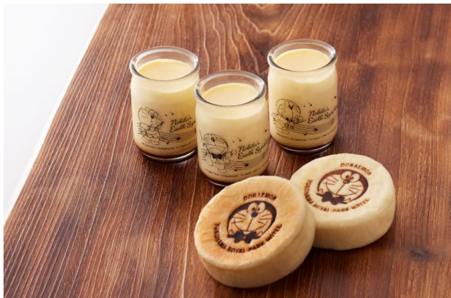
上：ドラえもんロイヤルプリン 各 540 円 下：ドラえもんイングリッシュマフィン 各 380 円 1F デリカ&ラウンジ「コフレ」

※お食事の料金には消費税(10%)・サービス料が含まれます。※特別企画商品のため、各種割引対象外です。