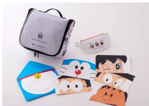
限定オリジナルグッズ イメージ

今回のタイアップを記念して5ホテル共通で限定オリジナルグッズをご用意しました。宿泊プランでは、旅先で便利なドラえもん柄のキュートなトラベルポーチに、四次元ポケットをイメージしたコインケース、キャラクターになりきって写真が撮れるポストカードフォトプロップスをお一人様につき1セットお持ち帰りいただけます。