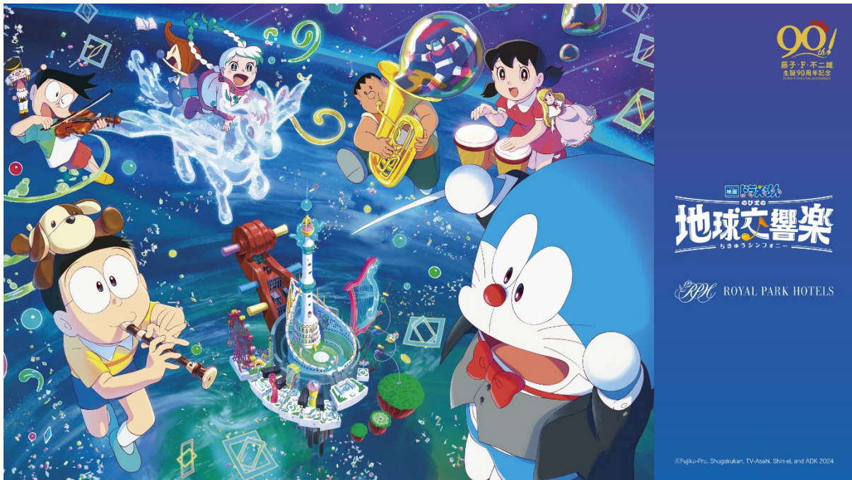
「映画ドラえもん のび太の地球交響楽 ロイヤルパークホテルズ タイアップ」 メインビジュアル

三菱地所ホテルズ&リゾート株式会社（所在地:東京都千代田区大手町 2-7-1、取締役社長 水村慎也）は、2024年3月1日(金)公開の『映画ドラえもん のび太の地球交響楽 (ちきゅうシンフォニー)』とタイアップし、映画公開に先駆けてロイヤルパークホテルズの5ホテルで2024年2月1日(木)より期間限定で宿泊プランやお食事、テイクアウト商品を順次販売いたします。