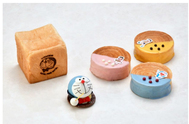
左：ドラえもん生食パン 648円 中央：ドラえもんムースケーキ 756円 右：クロワッサン3種 ドラえもん、のび太、しずか 各 486円 1F スイーツ&ベーカリー「粋」