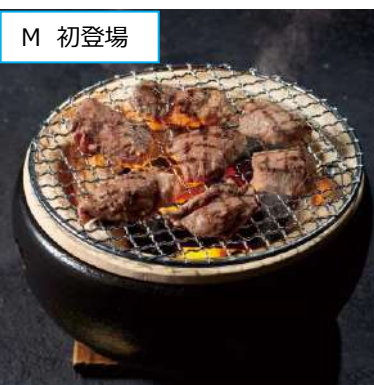
M 厚真「あづまジンギスカン」 ※初登場 塩コロジンギスカン (オーストラリア産、300g、1パック) 1,296円 <前半>