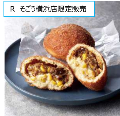
R そごう横浜店限定販売

1,201円 [各日限定 200 杯、そごう横浜店限定販売] <前半・イトイン>