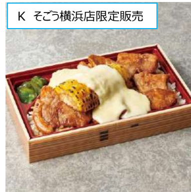
K 十勝清水 「ドライブインいとう清水本店」 秋の味覚&チーズ豚丼 (1折) 1,728円 [そごう横浜店限定販売] <前半・実演> とうもろこしの甘みと、チーズのコク、 甘辛い豚丼と相性抜群。