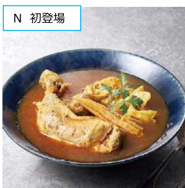
N 東神楽「シマチク」※初登場 スパイシースープカレー (450g、1箱) 1,296円 <通期> 骨付きの鶏モモ肉、10種類のスパイスが 効いたカレー。