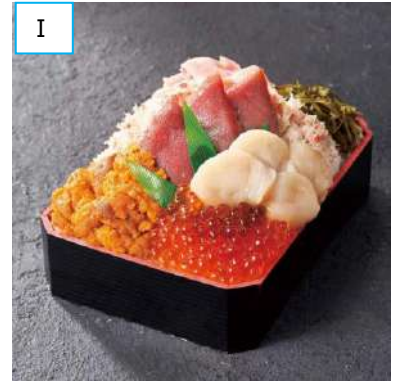
I 積丹「海のや」 生本まぐろ入5種盛弁当 (1折) 3,240円 [各日限定 30折] <通期・実演> かに・うに・いくらに生本まぐろと ホタテを盛り付け。