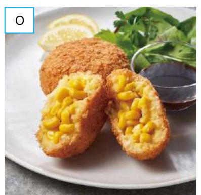
O 幕別「木川商店」 こぼれコーンコロケ (1個) 405円 [各日限定 100個] <前半・実演>