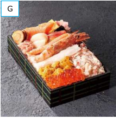
G 函館「海楽」 海峡の響き (1折) 2,160円 [各日限定 50折] <通期・実演> かに、うに、いくらなど 13種類の海の幸。