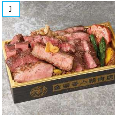
J 札幌「金獅子精肉店」 北海道牛10種盛りステーキ弁当 (1折) 2,700円 <通期・実演> ※9月22日(金)~10月3日(火) のみの販売。