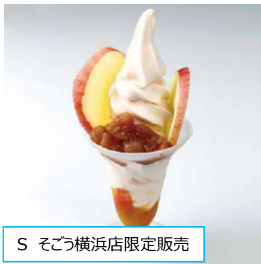
S そごう横浜店限定販売