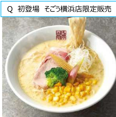
Q 初登場 そごう横浜店限定販売

1,100円 [各日限定 100 個、そごう横浜店限定販売] <通期・イトイン> ※ 9月 13日 (水) ~20日 (水) のみの販売。