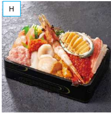
H 旭川「二條亭」 ぼたん海老とエゾアワビの贅沢弁当 (1折) 3,501円 [各日限定 50折] <通期・実演> ぼたん海老やアワビなど 10種類の海鮮が 楽しめる弁当。※9月13日(水)~20日 (水)のみの販売。