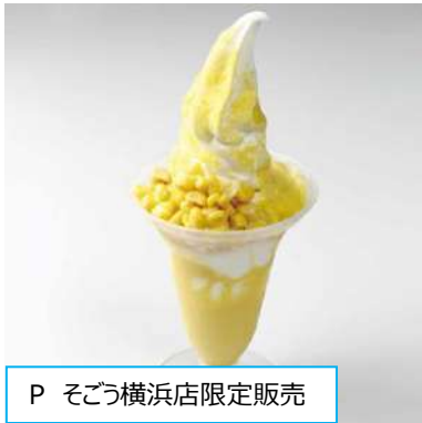
P そごう横浜店限定販売