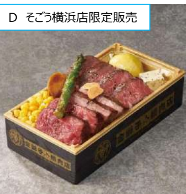
D そごう横浜店限定販売