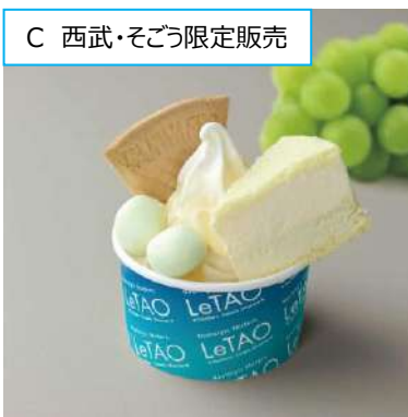
C 西武・そごう限定販売

(1杯) 1,100円 (前半・イトイン) 丸鶏、鶏ガラを炊きあげたスープに、野菜を使ったポタージュ状のスープを合わせたラーメン。