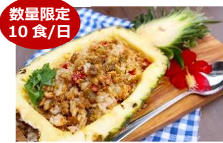
贅沢パイナップルガパオ

パイナップルをそのまま器にした、スパイシーなエスニックガパオライス。南国リゾート気分が楽しめます。