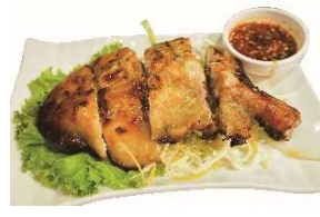
鶏もも丸ごとガイヤーン

グリーンカレーとキーマカレーのいいとこ取りをした、バジルの風味がふわっと香るオリジナルカレーに鮮やかな夏野菜を添えました。