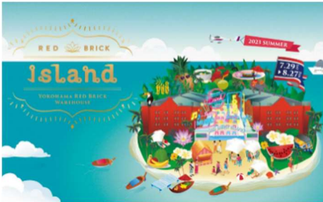
<イベントキービジュアル>

本イベントは、海を望む開放的なロケーションを活かし、横浜にいながら異国情緒な気分を味わえる夏季限定イベントとして2011年から開催し、今年で11回目となります。「アメリカの西海岸」や「アフリカ」など毎年テーマを変えて開催しており、例年会期中には約80万人が来場し、夏の風物詩としてご好評をいただいております。今年は「タイ」をテーマに、「パタヤ」エリアをイメージした歓楽街とリゾートアイランドの2つに分けた会場レイアウトで、エキゾチックな夏をお楽しみいただけます。