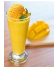
ごろっと果肉マンゴーフロスティ

王室にも認められたプレミアムビール。豊かな味わいが加わったビールは、バランスの取れた味わいです。