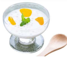
マンゴーサークピアック

カラフルなトッピングが楽しい、タイ風かき氷「ナムケンサイ」。エコフレンドリーなおりがみカップを使用し、提供。