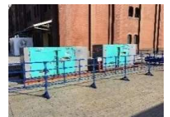
〈GTL 燃料発電機イメージ〉