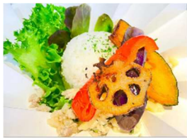
タイ風 夏野菜のグリーンキーマカレー

グリーンカレーとキーマカレーのいいとこ取りをした、バジルの風味がふわっと香るオリジナルカレーに鮮やかな夏野菜を添えました。