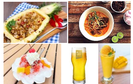
<提供メニューイメージ>