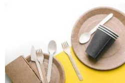
〈脱プラスチックイメージ〉

横浜みなとみらい 21 地区の「脱炭素先行地域」の取り組みに参画する施設として、フードメニューの容器・カトラリーを非プラスチック製品に切り替え、脱プラスチックを推進するほか、イベントで使用する電力を「GTL 燃料」で発電することによる CO2 排出対策を行うなど、サステナビリティ活動に取り組めます。