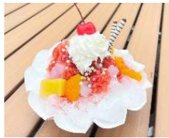
タイ風かき氷 (ナムケンサイ)

カラフルなトッピングが楽しい、タイ風かき氷「ナムケンサイ」。エコフレンドリーなおりがみカップを使用し、提供。