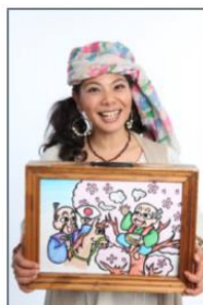
紙芝居師なっちゃん