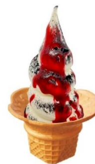
「閻魔様のどろどろソフトクリーム」