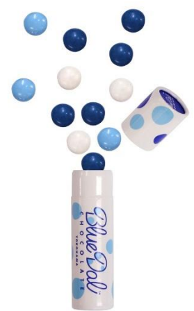
限定プレゼント「ブルーダルチョコレート」

『新・雨の日キャンペーン』、『新・視界ゼロキャンペーン』は、通常の大人入場料金1,000円でご入場いただき、オリジナルポストカード1枚、ドリンク1杯がもらえるお得なキャンペーンです。ドリンクは生ビール、ハイボール、レモンサワー、ソフトドリンク、昨年登場したキャンペーン開催時のみ登場するオリジナル限定ドリンク「空庭慈雨（くうていじう）」の中から、好きなドリンクをお選びいただけます。当日、併設のスカイカフェにてドリンク引換券をお渡しいただき、お召し上がり下さい。今年は6月1日(木)～梅雨明け※まで、先着20名様にプレゼントもご用意しております。（※関東の梅雨明け）