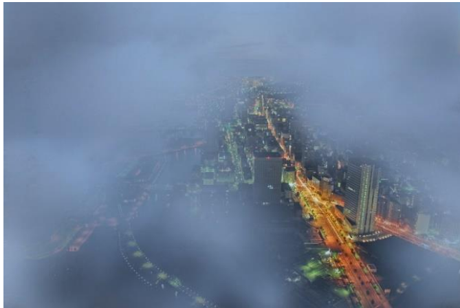
雨天時、眼下に雲を望むスカイガーデンからの景色（一例）

横浜ランドマークタワー 69階展望フロア「スカイガーデン」(神奈川県横浜市／運営：三菱地所プロパティマネジメント株式会社)はお出かけをする日にお天気がすぐれなくて、少し残念な思いをされる方にも楽しんでいただけるよう、『新・雨の日キャンペーン』を開催致しております。本キャンペーンは、平日の雨の日にご来場頂いた際、みなとみらいオリジナルポストカード1枚とドリンク1杯をプレゼント。また、土日・祝日に展望フロアからの眺めが雲に覆われていた場合『新・視界ゼロキャンペーン』を実施し、景色が望めなくてもポストカードとドリンクでお客様をおもてないたします。さらに2023年は6月1日(木)～梅雨明け※までのキャンペーン開催時、先着20名様に、甘さで心が雨粒のように弾む「ブルーダルチョコレート」をご用意。昨年から登場した幻の限定ドリンク「空庭慈雨（くうていじう）」とともに、お天気がすぐれない日もスカイガーデンで幻想的な時間を過ごし下さい。（※関東の梅雨明け）