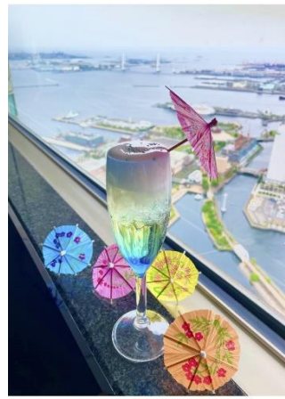
限定ドリンク「空庭慈雨（くうていじう）」