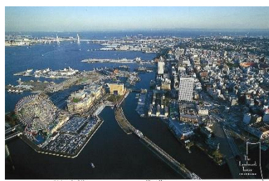
Yokohama Bay City

本キャンペーン開催時に限定配布となるオリジナルポストカードには、横浜・みなとみらい屈指の絶景であるスカイガーデン自慢の眺望や、横浜を象徴するウォーターフロントの街並みなどが描かれております。当日スカイガーデンチケット窓口にて、数種類の絵柄の中からランダムでお渡しさせて頂きます。※画像はイメージです。ポストカードはデザインが変更になる場合がございます。