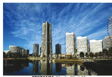
YOKOHAMA Minato Mirai 21