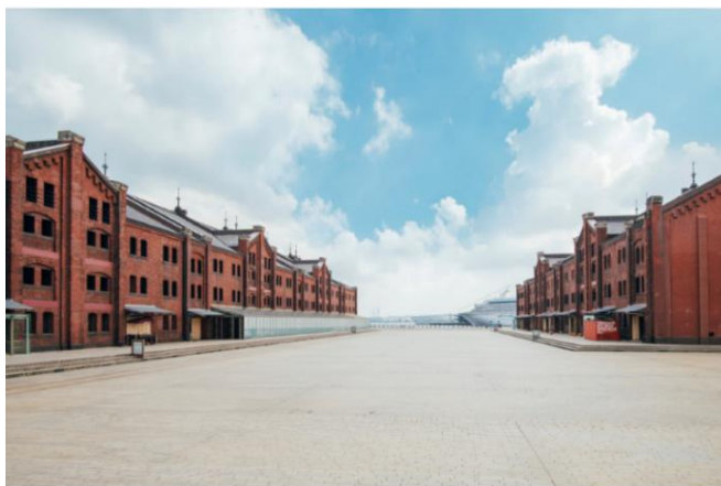
<横浜赤レンガ倉庫 外観イメージ>