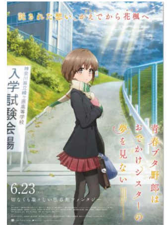
©2022 鴨志田 一/KADOKAWA/青ブタ Project

本シリーズでは、主人公・梓川咲太と、思春期特有の感情が不思議現象として現れる“思春期症候群”を引き起こした少女達が繰り広げる、切なくも瑞々しい思春期ファンタジーが描かれ、2018 年に TV アニメ『青春ブタ野郎はバニーガール先輩の夢を見ない』が放送されると、メインヒロイン・桜島麻衣をはじめとする魅力的なキャラクターや、思春期の感情を豊かに描いた繊細なストーリーが話題となり、翌年 2019 年に、続編となる劇場アニメを公開。2023 年 6 月 23（金）に控えるシリーズ最新作『青春ブタ野郎はおでかけシスターの夢を見ない』の公開に向け、さらなる盛り上がりを見せています。