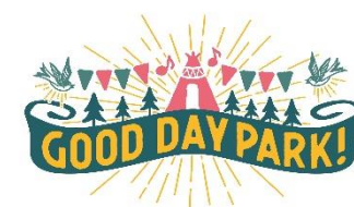
『GOOD DAY PARK! 2023』 □□

※最新情報は施設公式HP ( https://www.mec-markis.jp/mm/ ) にてご確認ください。