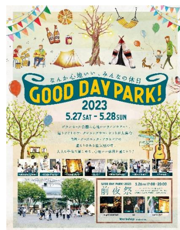
GOOD DAY PARK! 2023 (5/27(土)・5/28(日)) MARK IS みなとみらい・横浜ランドマークタワー GOOD DAY PARK! 2023 実行委員会