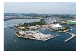
横浜・八景島シーパラダイス 空撮写真

『横浜・八景島シーパラダイス』では、これからも「海」で“くらす生きもの”や“素晴らしさ”、“海を取り巻く環境”等について、展示や企画を通して発信し、すべてのお客様に笑顔溢れる体験や感動をお届けします。