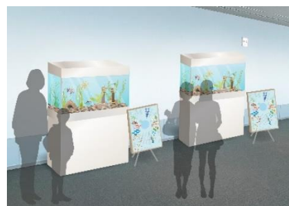
「社会科水槽」展示イメージ ※画像はイメージです。