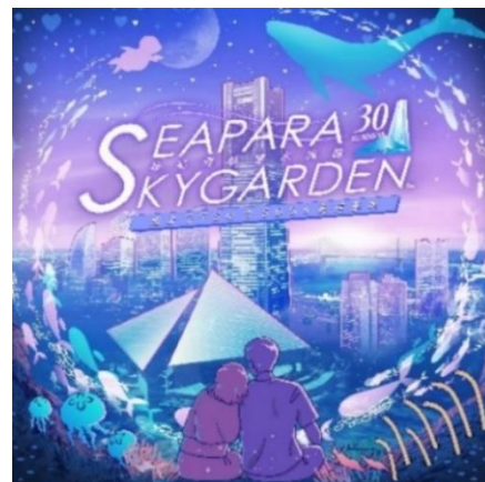
「シーパラ×スカイガーデン天空のペアシートチケット」 キービジュアル