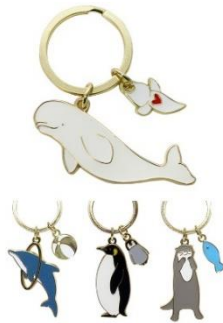
【アニマルキーチャーム】