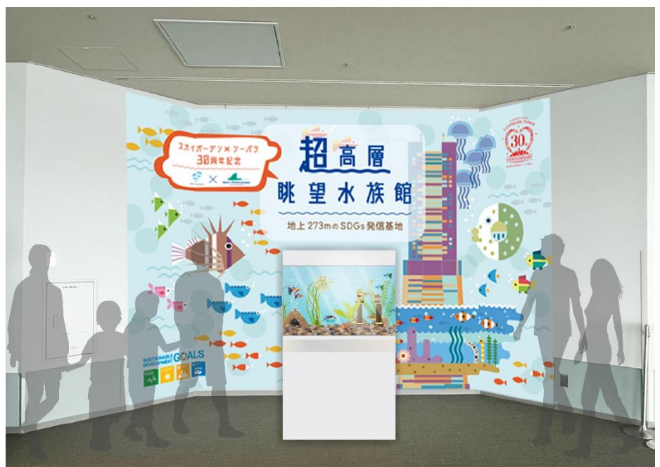
『WELCOME』エリア 展示イメージ ※画像はイメージです。