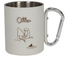
【キャンプクリップマグ】