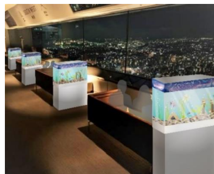
「ソファ水槽」イメージ ※画像はイメージです。

この機会に、スカイガーデンからの夜景と共に、ゆったりしたひと時を楽しんでみてはいかがでしょうか。